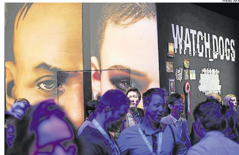
Ubisoft a créé involontairement la panique en envoyant, à un magazine australien, son nouveau jeu Watch Dog à l'intérieur d'un étrange coffre-fort noir.

Un chevreuil qui errait dans les rues de Toulouse a été pris en chasse par les policiers et s'est réfugié chez les gendarmes dans une caserne où il a fini par être capturé. Les policiers ont été alertés vers 4h30, la semaine dernière, de la présence sur la voie publique de l'animal qui divaguait dans une rue de l'est de Toulouse. A leur vue, le chevreuil a pris la fuite,